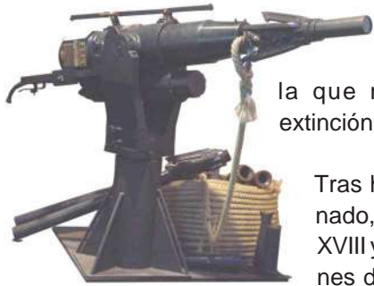
Cañon y arpón ballenero siglo XX

De las especies actuales de ballenas, la franca es la que más cerca de la extinción ha llegado.