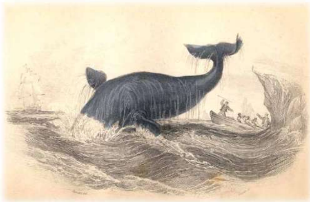
Balleneros: Según una ilustración del siglo XVIII

Hoy existen otras amenazas para esta especie: la contaminación en los mares y océanos y las infracciones que puedan cometer las embarcaciones que se dedican a la práctica turística del avistaje de ballenas.